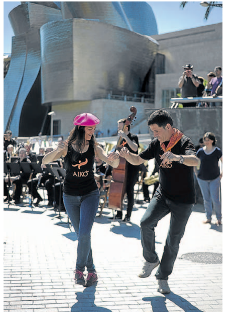
Los bailarines de Aiko y la Banda Municipal de Bilbao, de jota.

3. Canjea tu cupón en el establecimiento elegido