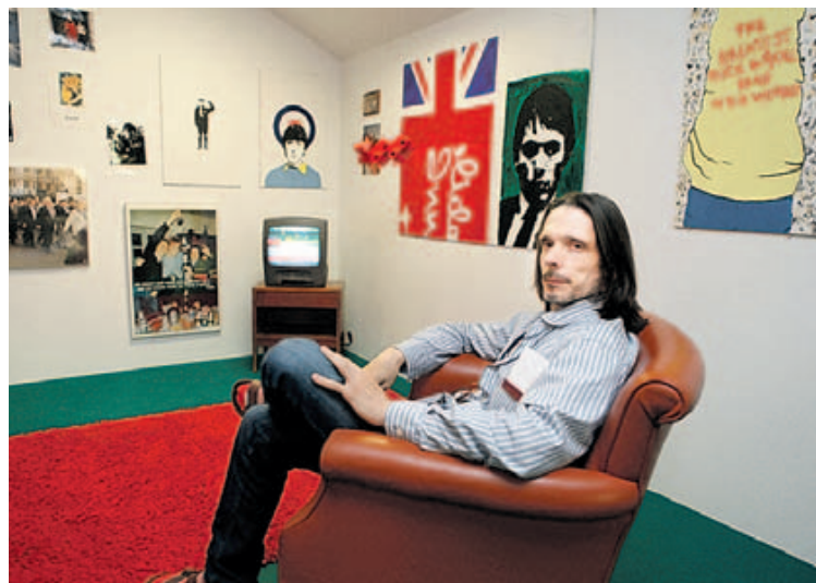
La muestra de Deller se podrá visitar hasta octubre.

La obra tiene símbolos, iconos, objetos y módulos de circulación que el artista muestra a partir de sus estereotipos. Deller recrea una batalla de mineros sobre lo que ha interpretado como una lucha de la clase obrera con la clase política.